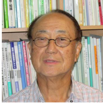
曾我部理事（栃木県会会長）