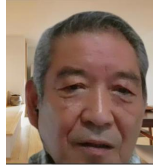
牧理事（神奈川県会副会長）