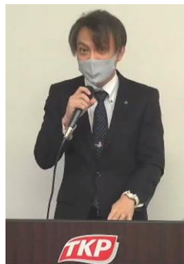
監査報告 櫻岡監事